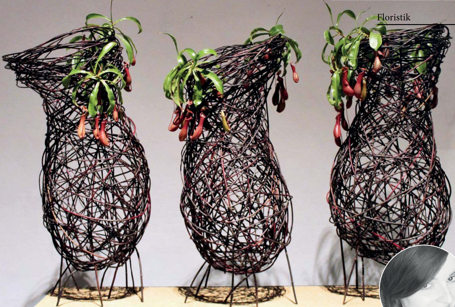
Die Triologie der drei überdimensionalen Hohlkörper ist eine Hommage an die Kannenpflanzen. Petra Huber (Landau/D) bildete aus Weidenzweigen drei übergroße Formen und verband sie mittels einem gemeinsamen Sideboard zu einem Ganzen. Bewusst akzentuiert setzte sie echte Kannenpflanzen hinzu, damit das „Vorbild“ auch in Erscheinung treten kann und die Kreation damit selbsterklärend wird