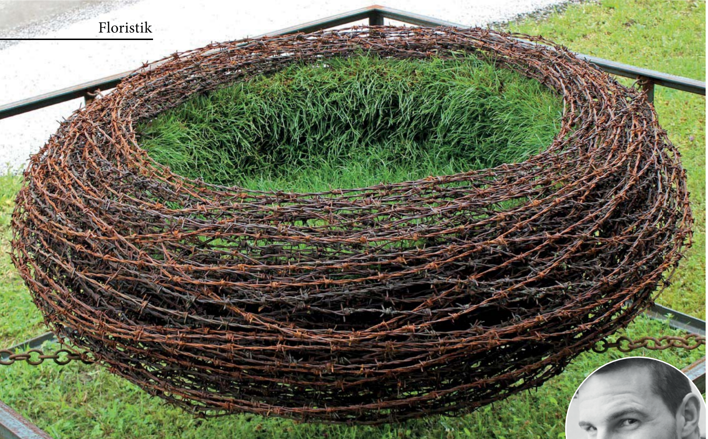
Tobias Sandholzer (Klaus/Ö) schuf in seiner Gestaltung mit Pflanzen eine verschlungene Form aus verrostetem Stacheldraht. Die introvertierte Wirkung stellt eine überspitzte Darstellung des Schutzbedarfs eines Nestes dar, runde Form und spitze Stacheln stehen im bewussten Gegensatz