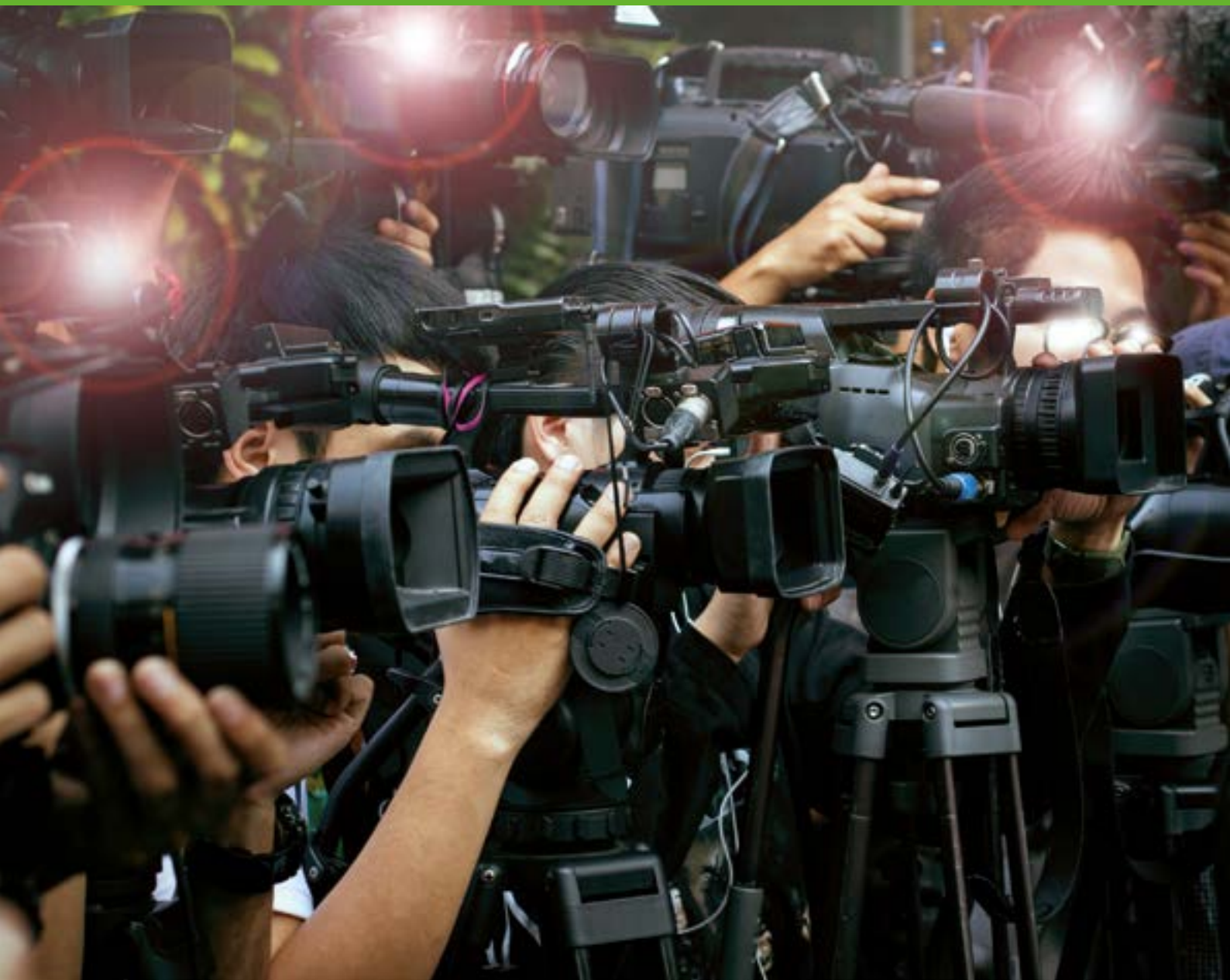
Foto und Video Kreativität und Technik