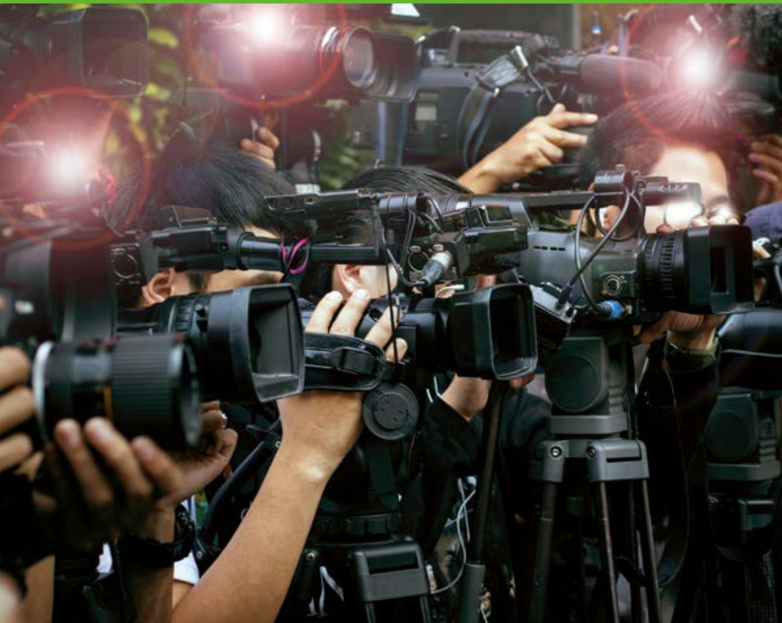
Foto und Video Kreativität und Technik