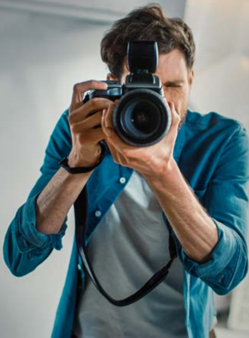
Foto und Video Kreativität und Technik