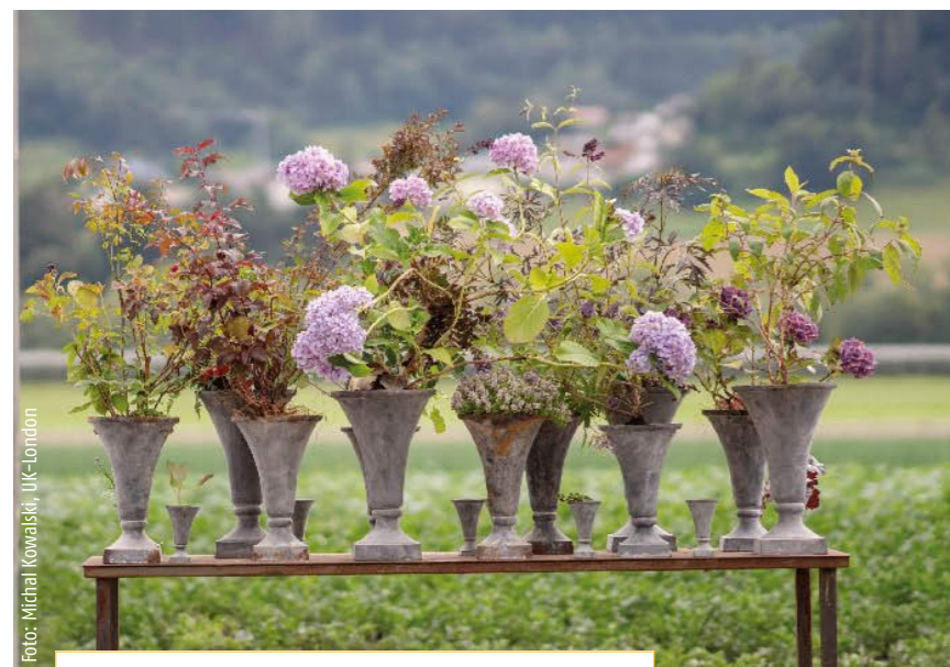
Mehrteilige Gefäßbepflanzung auf einem Sideboard zu einem Ganzen vereint (Verena Irsslinger, Schweiz)