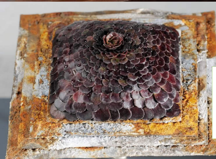
Rost und Patina, also Spuren des Gebrauchs und des Alters, wählte Vanessa Deppeler für ihren Brautschmuck. Der Korrosion, welche durch Zufall entsteht, stellte sie das Quadrat und die exakt ausgerichteten Schichtungen entgegen