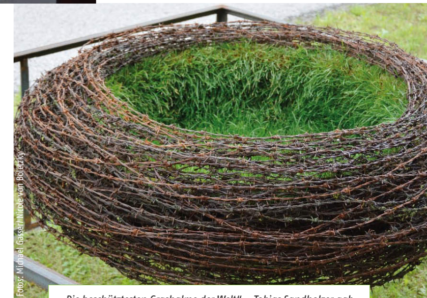
„Die beschütztesten Grashalme der Welt“ – Tobias Sandholzer gab dem Rasen, der üblicherweise mit Füßen getreten wird, den totalen Schutz durch eine konvexe Schalenform aus Stacheldraht